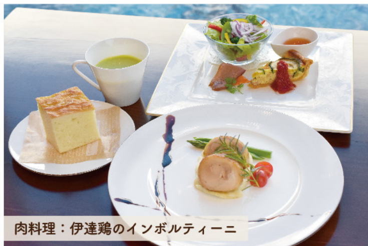
肉料理：伊達鶏のインボルティーニ