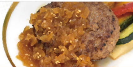
自家製和風オニオンソース