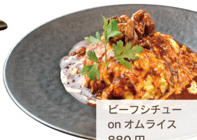
ビーフシチュー on オムライス