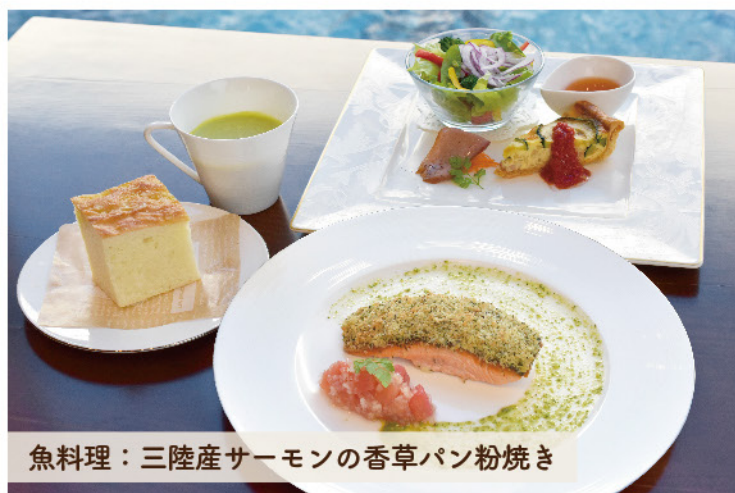
魚料理：三陸産サーモンの香草パン粉焼き