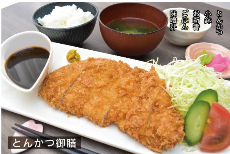
とんかつ 小鉢 お新香 ごほん 味噌汁