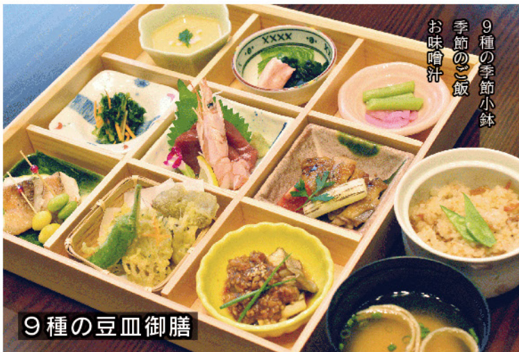
9種の季節小鉢 季節のご飯 お味噌汁