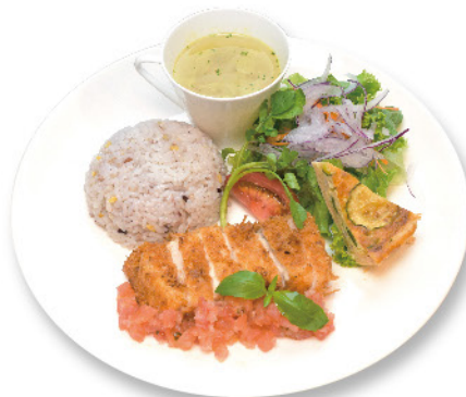
◆カジキマグロのカツレツ フレッシュトマトソース