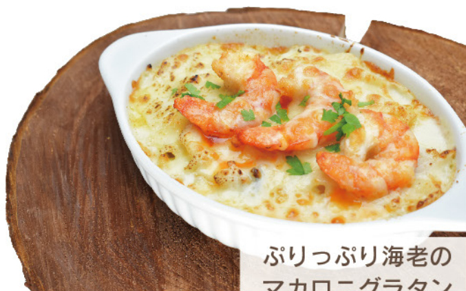
ぷりっぷり海老の マカロニグラタン