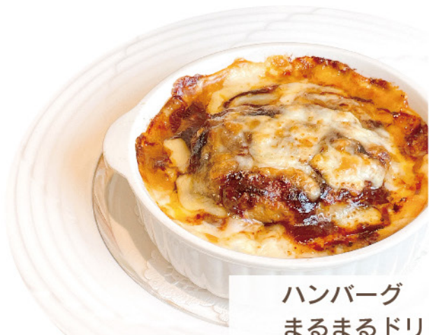
ハンバーグ まるまるドリア