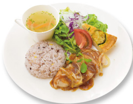
◆低温調理した豚肩ロースの ポークジンジャー